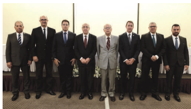
Enesp 2018, em Goiânia, contou com a participação do então secretário de Segurança Pública do Estado de Goiás e ex-governador, Irapuan Costa Júnior