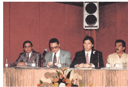
VIII Enevist, agosto de 1992, Goiânia/GO