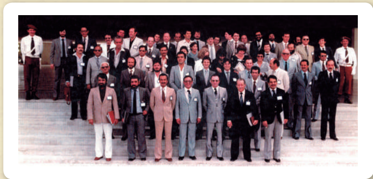
1º Encontro Nacional de Empresas de Vigilância, Asseio e Conservação, maio de 1982, Curitiba/PR