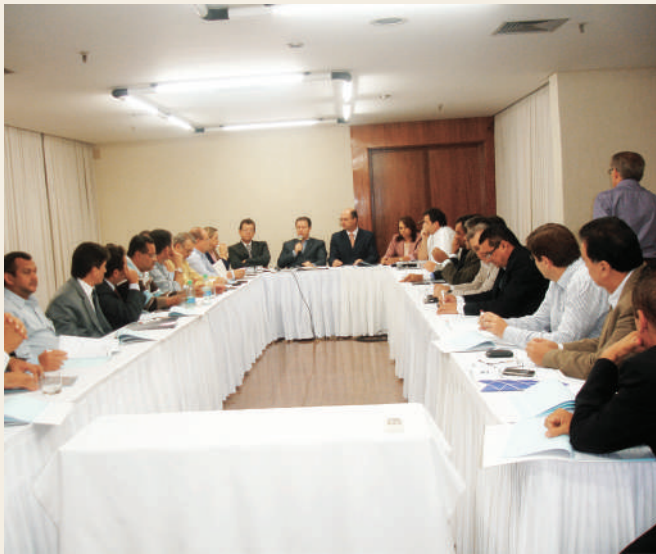
Febrac e Fenavist realizaram a AGE em Goiânia (GO) para prestigiar os Sindicatos Filiados.