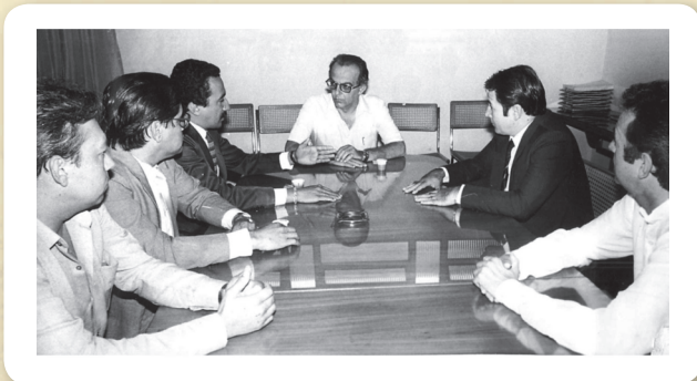
Reunião da diretoria do Seac-GO com o governador Henrique Santillo, 1987