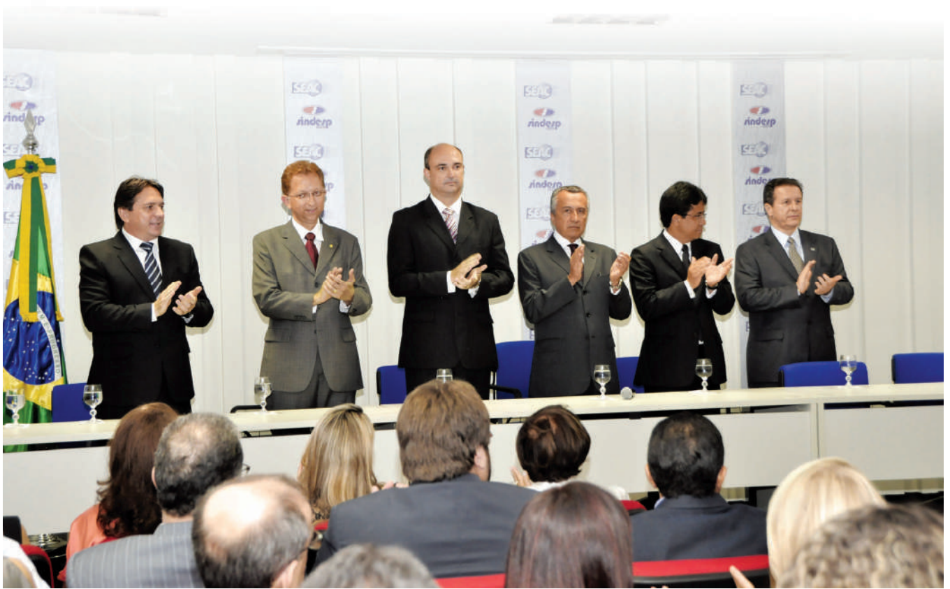
Solenidade de inauguração reuniu os presidentes do Seac-GO, Sindesp-GO, Fenavist, Febrac e outras autoridades.