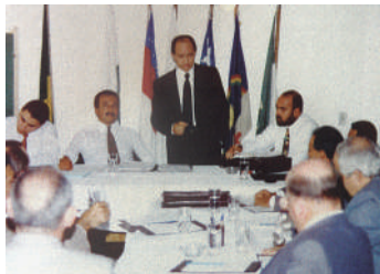
Representantes da Fenavist na sede do Lago Sul, área nobre de Brasília/DF