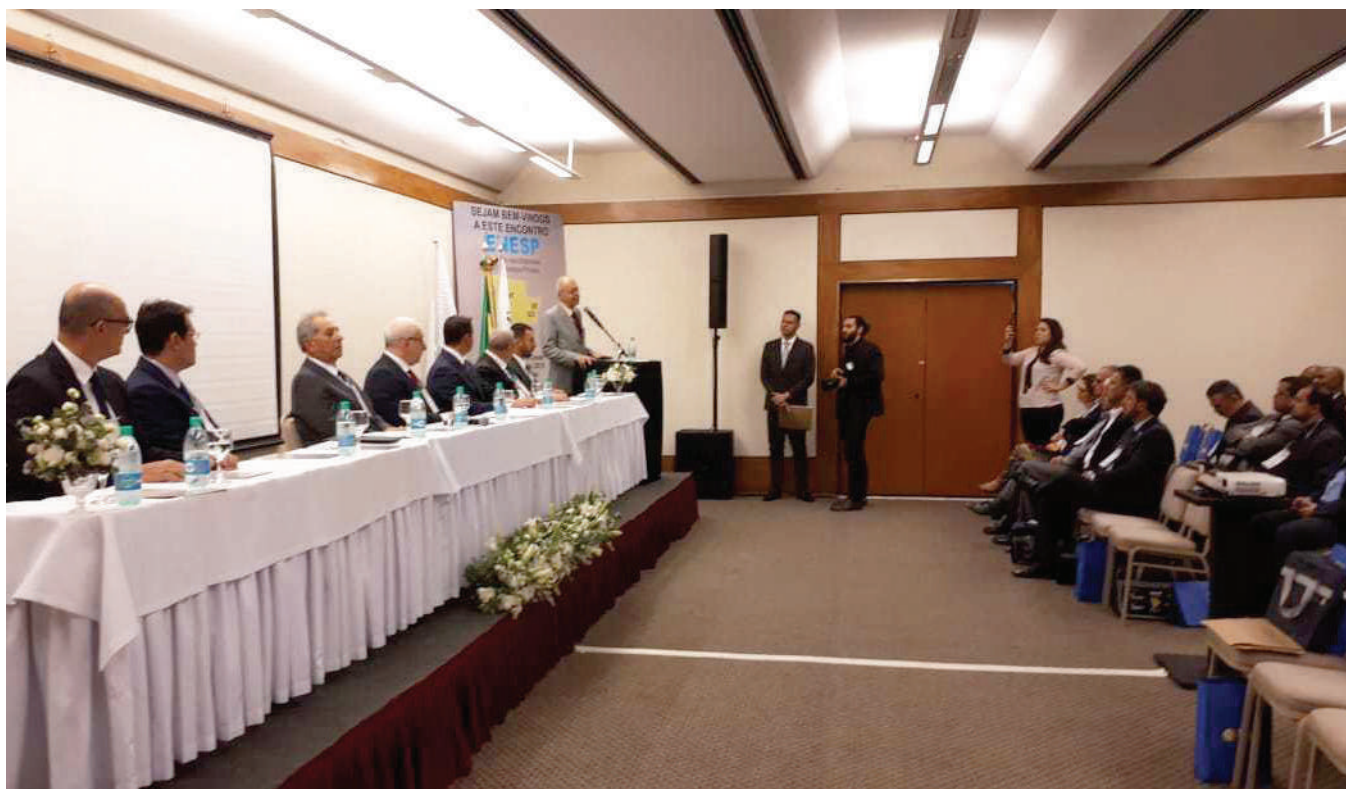
Abertura do Encontro Nacional das Empresas de Segurança Privada Região Centro Oeste, em Goiânia (GO), em 2018.