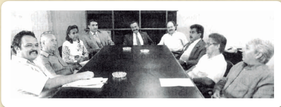
Desde o início, o respeito ao Estatuto e aos princípios da moral e da ética