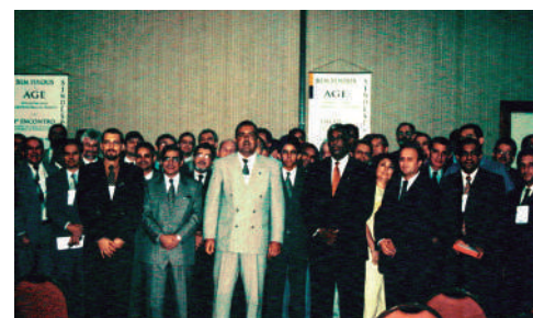
1º Encontro das Delesp-MG novembro 1999