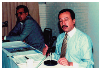
AGE Fenavist - maio de 1997