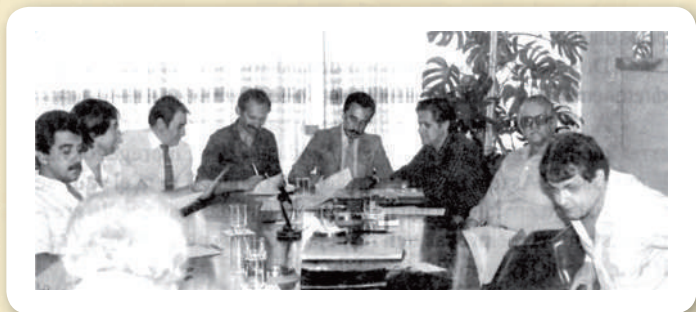
1ª Convenção Coletiva firmada com o Seasons, na antiga sede do Palácio do Comércio, em Goiânia/GO.