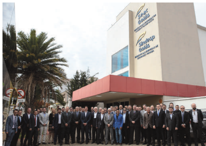
Participantes do Enesp 2018/Goiânia, em frente a sede própria dos Sindicatos