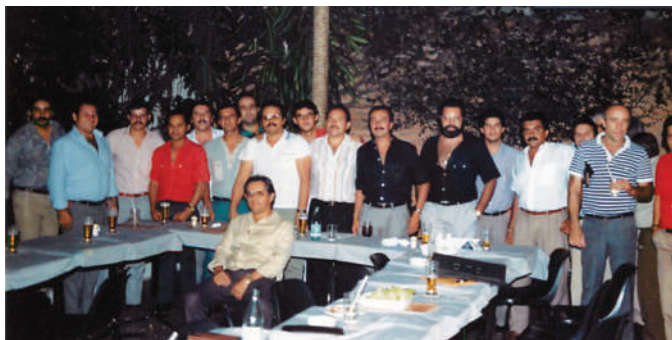
Confraternização do Sevitego, criado em 1989 e que deu origem ao Sindesp-GO