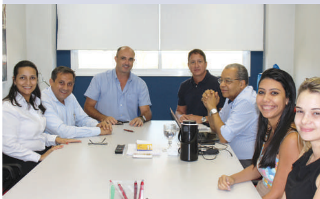
Auditoria ABNT de Recertificação na norma ISO 9001:2015, em setembro/2017

Crescimento e fortalecimento são princípios que o Seac-GO e Sindesp-GO sempre defenderam. Uma década de diferença de fundação entre as duas entidades só agregou mais valor ao processo de consolidação no cenário econômico, ao priorizar a qualidade e excelência na prestação de serviços.