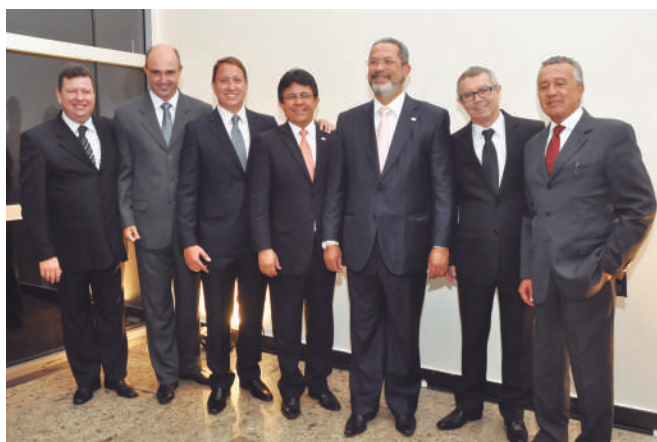
Solenidade de posse das novas diretorias (2014/2018) do Seac-GO, Sindesp-GO e Ageps, em março/2014