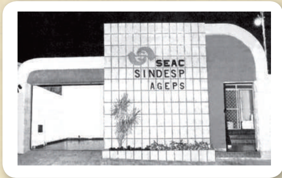
1ª sede própria do Seac-GO, Sindesp-GO e Agesp