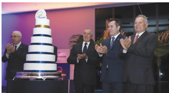
Presidentes e ex-presidentes da Fenavist comemoram 30 anos da entidade