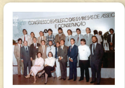
I Congresso Brasileiro das Empresas de Asseio e Conservação, em julho/1985, em Belo Horizonte (MG)