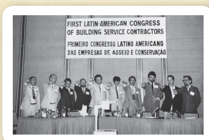
Seac-GO no 1º Congresso Latino Americano das Empresas de Asseio e Conservação, Rio de Janeiro, 1983