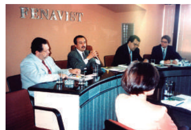
Reunião na sede da Fenavist, Lago Sul de Brasília/DF